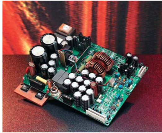
Power Supply Section