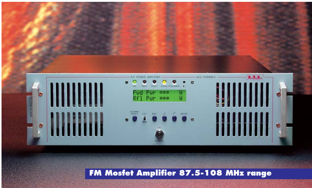
FM Mosfet Amplifier 87.5-108 MHz range

AMPLIFIERS TRANSMITTERS ANTENNAS ACCESSORIES